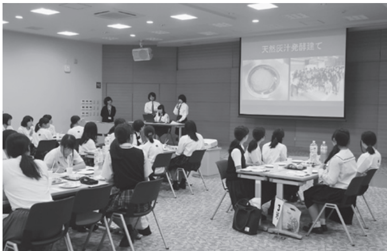
プレ・エシカル甲子園（次世代エシカルフェス）

や高校が徳島に集い、取組紹介やディスカッションする「エシカル消費自治体サミット」や「次世代エシカルフェス」を開催し、全国にエシカルの共感の輪を広げました。今年度は、この取組をレガシーとして、本年12月に、全国から高校生が徳島に集い、私たちが創る持続可能な社会をテーマに、エシカルな取組を発表・交流する、全国初の「エシカル甲子園2019」を開催し、全国への発信を強化してまいります。