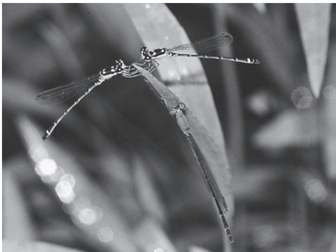
潤沼で発見されたヒヌマイトトンボ

における水深が6メートルを超えない海域を含む。 日本においては、1980年6月17日に加入書を寄託機関たるユネスコに寄託し、同年10月17日に効力が発生した。(以上、環境省ホームページより抜粋) 潤沼がラムサール条約に登録された基準は、「国際的に絶滅のそれのある種又は消滅の危機に瀕している生物群集を支える上での重要な湿地」、「動植物のライフサイクルの重要な段階を支えている湿地」、「水鳥の種又は亜種の個体数の1%以上を定期的に支える湿