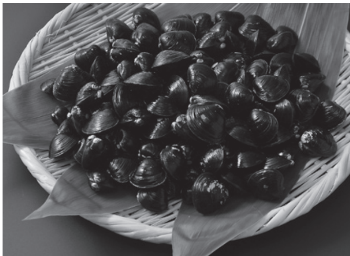
名産のヤマトシジミ

茨城町では、関東地方唯一の汽水湖である「涸沼」の優れた環境、存在する動植物、食文化等を将来の世代へ確実に引き継ぐことを目的として「茨城町ラムサール条約登録湿地涸沼に関する条例」を制定した（条例第20号として平成27年6月29日公布、同日施行）。涸沼は、本年5月にラムサール条約湿地への登録を受け、町は自然環境の保全と賢明な利用を推進している。