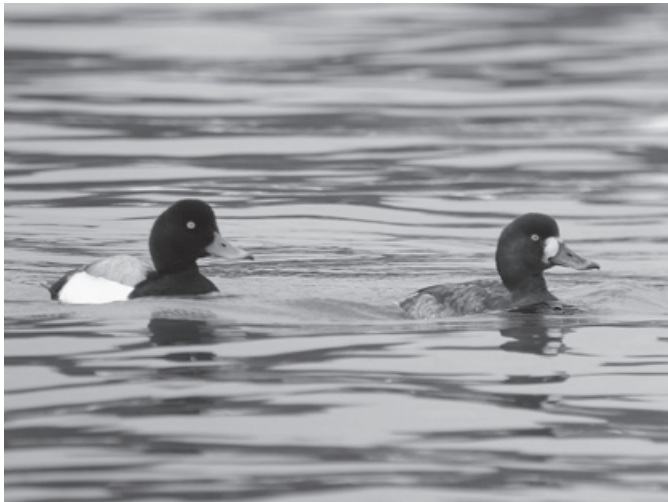
3000羽程度が飛来するスズガモ

における水深が6メートルを超えない海域を含む。 日本においては、1980年6月17日に加入書を寄託機関たるユネスコに寄託し、同年10月17日に効力が発生した。(以上、環境省ホームページより抜粋) 潤沼がラムサール条約に登録された基準は、「国際的に絶滅のそれのある種又は消滅の危機に瀕している生物群集を支える上での重要な湿地」、「動植物のライフサイクルの重要な段階を支えている湿地」、「水鳥の種又は亜種の個体数の1%以上を定期的に支える湿