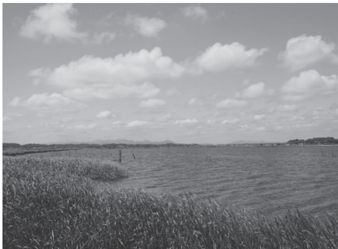
ラムサール条約に登録された涸沼