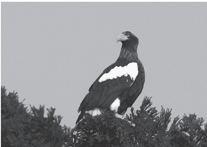
冬期に飛来するオオワシ

この条約の適用上、湿地とは、天然のものであるか人工のものであるか、永続的なものであるか一時的なものであるかを問わず、更には水が滞っているか流れているか、淡水であるか汽水であるか鹹水（かんすい、注：塩水のこと）であるかを問わず、沼沢地、湿原、泥炭地又は水域をいい、低潮時