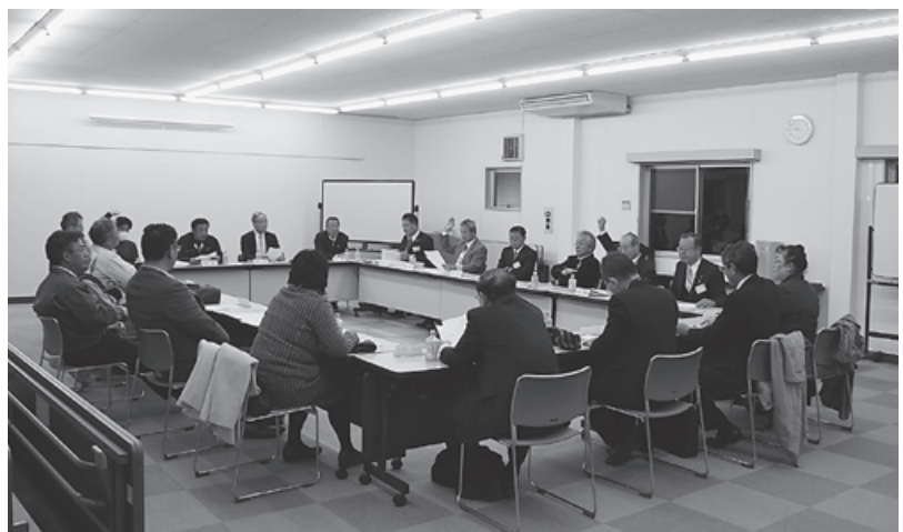
全体会での協議の様子

本条例案の作成に当たっては、未来創造実践部の担当役員と議会事務局で検討しては、部会や議会運営委員会で協議・調整するの繰り返しでした。同年12月にパブリックコメント