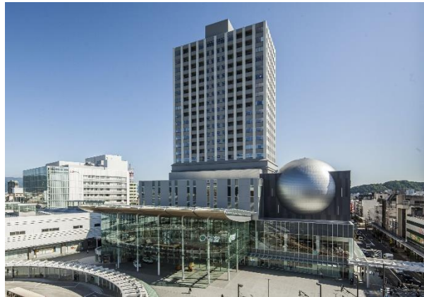
図表2 「ハピリン」の外観