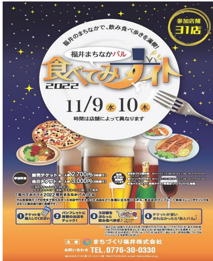
図表4 「食べてみナイト」

ン」と周辺商店街の魅力を発信するとともに回遊性向上の相乗効果を狙い、エリアでのにぎわい創出を試みている。