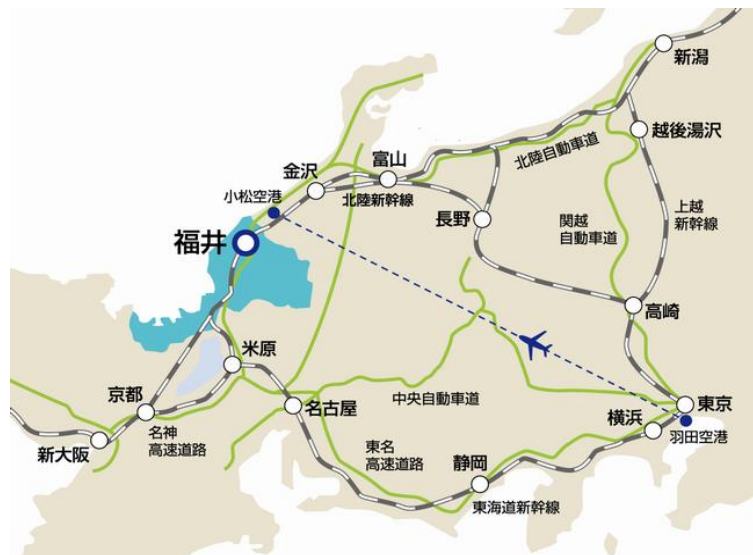
図表1 福井市の位置図