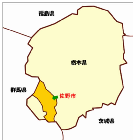
図表 1 佐野市の位置図