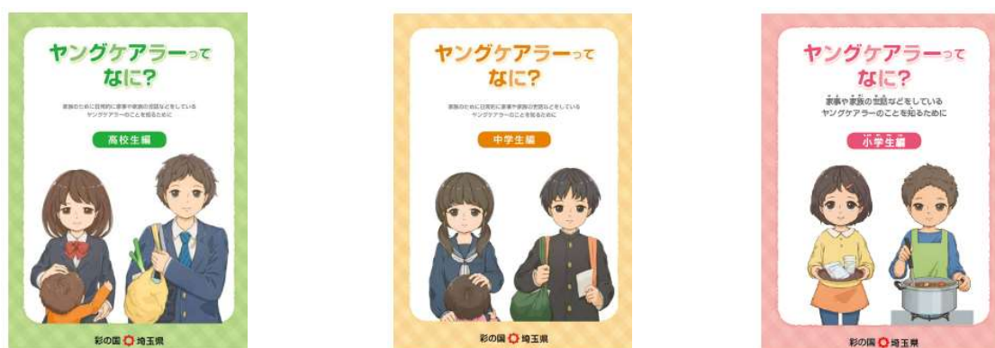
図表2 ヤングケアラーハンドブック

令和3年度から、教育局人権教育課が、県内中学校・高校等で、「ヤングケアラーサポートクラス」という出張授業を行っている。この出張授業では、有識者や元ヤングケアラーが学校を訪問し、教職員や生徒に向けてヤングケアラーに関する講演を実施している。この授業は、教職員、生徒、保護者がヤングケアラーに対する理解を深め、学校における相談支援を充実させることを目的としている。令和4年度は、15校1団体で「ヤングケアラーサポートクラス」が実施され、令和5年度も、16市町で実施が予定されている。さらに、県立高校50校において、ヤングケアラーに関する授業を含む、独自プログラムが行われることとなっている。