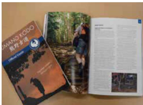
図表 4 ブラッド氏作成の英文ガイドブック

地元を深く理解しているネイティブが一元化された情報発信を行うことで、外構人目線の情報発信が可能となった。