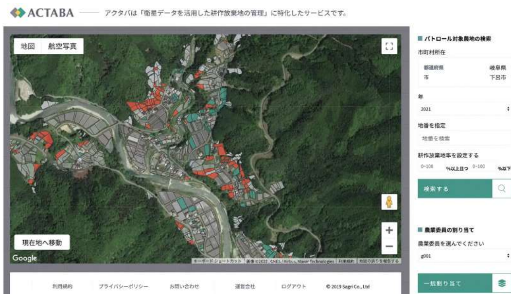
図表3 「ACTABA」の画面イメージ

農業委員会事務局のパソコンと、現地調査を行う農業委員のタブレットを連動させることで、事務局のパソコンでは農地全体の把握、調査に当たる農業委員の農地の割当等が可能になり、農業委員は、調査結果の入力と事務局との共有等が容易になる。また、下呂市で管理している台帳、国への提出が必要なフォーマット、「農地情報公開システム」というデータベース等、様々なひな型において、情報の整理、出力、提出の対応が可能である。