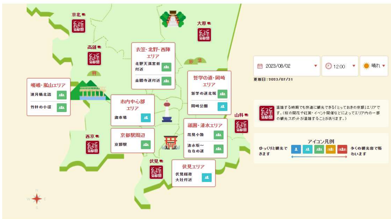
図表3 京都観光快適度マップ

また、令和3年10月から、英語と中国語でも情報を発信しており、混雑予測には、外国人の位置情報データも活用されている。さらに、京都市観光協会は、情報提供の対象地点や、リアルタイム映像配信のためのカメラを増やした。このように、より利便性の高いマップや関連機能の提供が目指されている。