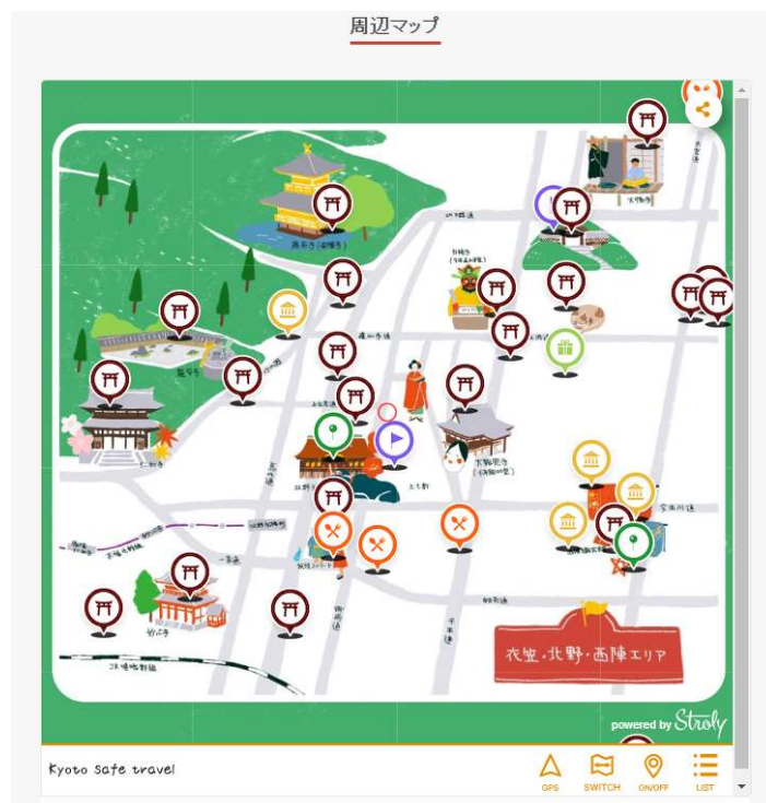
図表7 エリア別イラストマップ

観光客が、エリア内の観光スポットの位置関係を把握することができるように、京都市観光協会のホームページにイラストマップが掲載されている。京都市内のベンチャー企業、Stroly社の協力で、このイラストマップは、閲覧者の所在地情報がマップ上に表示される機能を持っている。