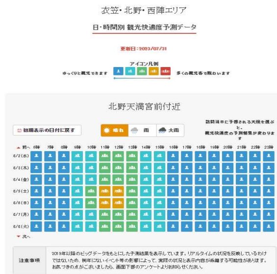
図表5 観光快適度予測データ

「観光快適度」は、KDDI 株式会社と技研商事インターナショナル株式会社が共同開発した、位置情報ビッグデータ分析ツールである、「KDDI Location Analyzer」の情報と、天気、曜日等の条件を考慮しながら、旧 Facebook 社が開発した予測手法である、「Prophet」を活用して予測されている。