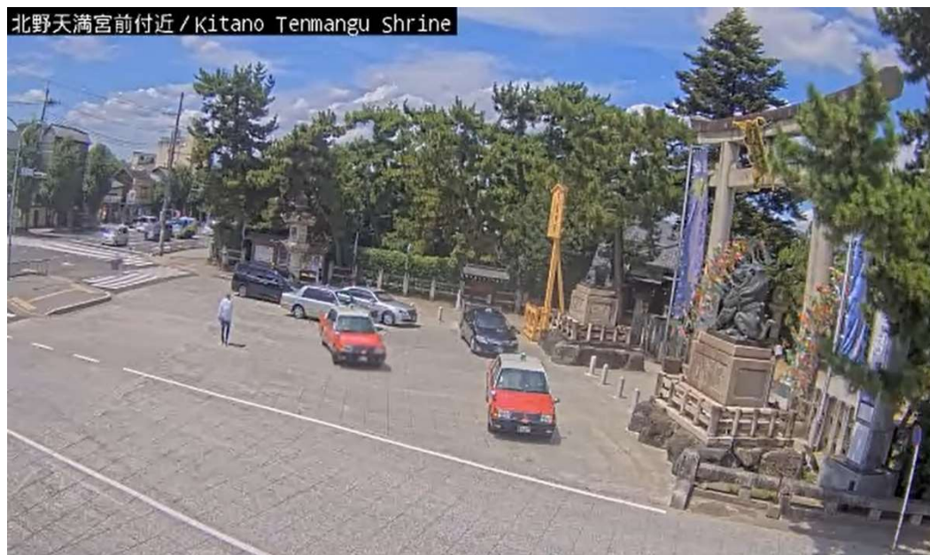
図表8 リアルタイム映像

時間帯別観光快適度予測の表示スポットにおける状況確認のために、表示スポットのリアルタイム映像が配信されている。これによって、観光客は、混雑する時間帯を避けて訪問することができる。