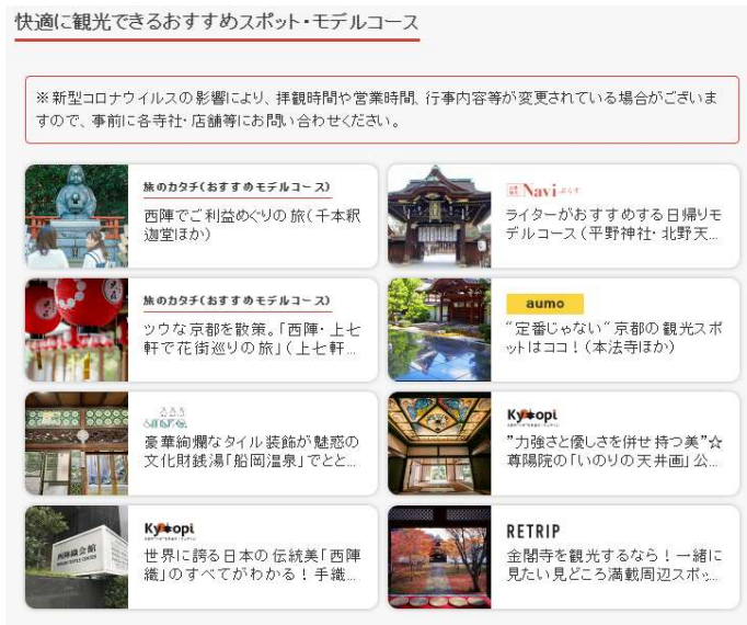
図表6 観光スポット情報