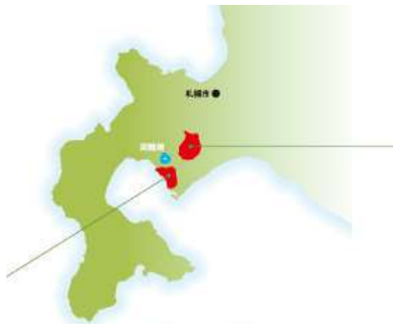
図表1 伊達市の位置図