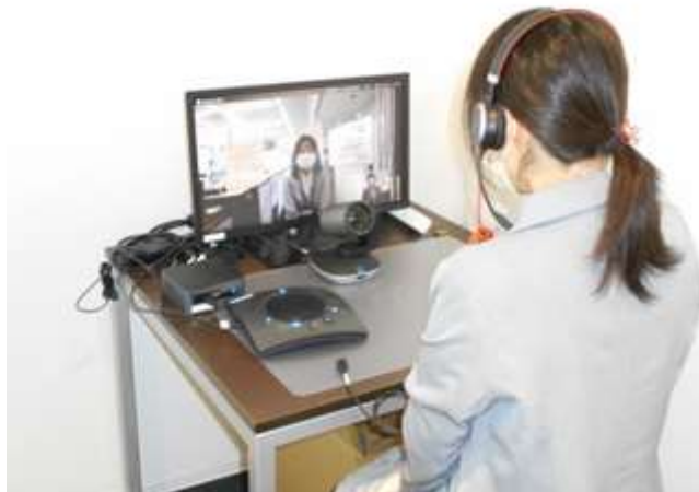
図表3 オンライン窓口を利用している様子