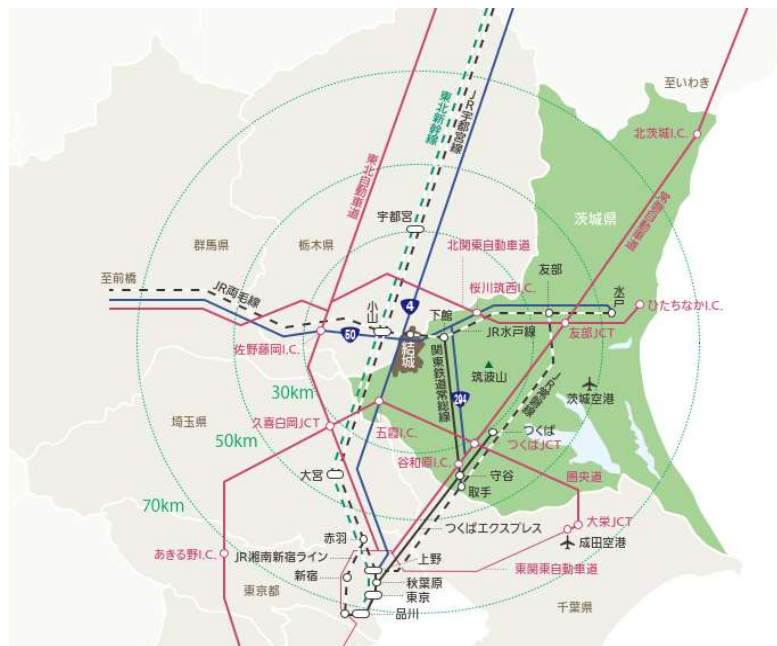
図表1 結城市の位置図