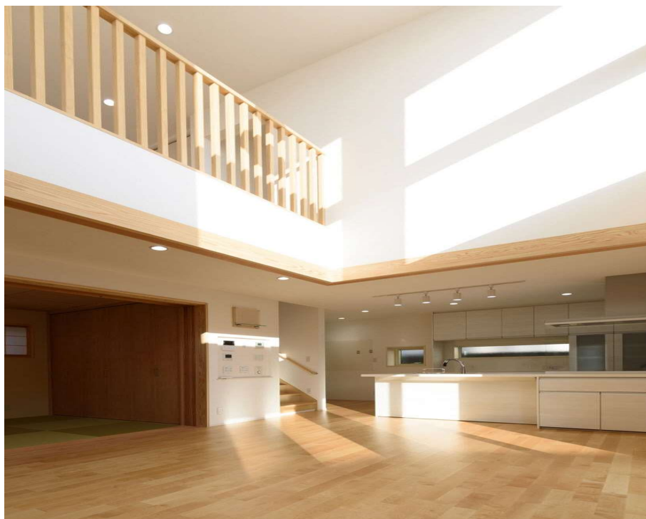
図表3 やまがた省エネ健康住宅の内部②