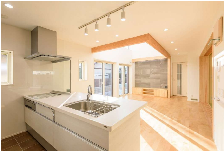
図表2 やまがた省エネ健康住宅の内部①