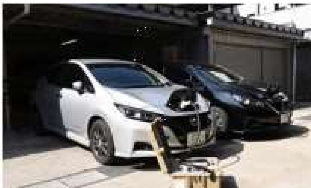
図表3 電気自動車からの外部給電