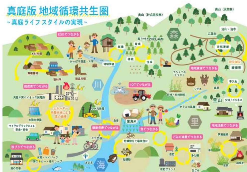
図表2 真庭版 地域循環共生圏