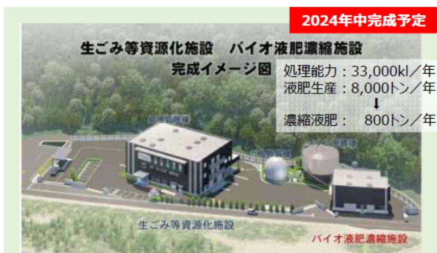
図表4 生ごみ等資源化施設のイメージ

令和6年度中の施設の完成と稼働を目指しており、市民等への生ごみの分別の説明会等を開始している。