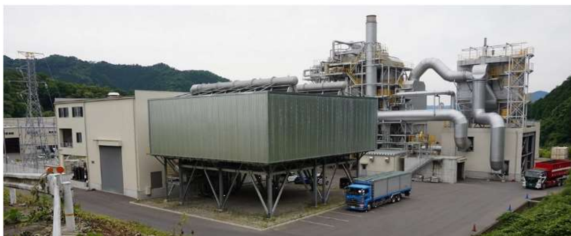
図表 3 真庭バイオマス発電所

木質バイオマス活用の一環として、平成 21 年に、真庭市内の木材産業が共同で「真庭バイオマス集積基地」を整備した。市内の製材所等で発生する樹皮等が集められ、集積基地でチップに加工され、燃料として販売・利用する、という取組である。そして、平成 24 年度に固定価格買取制度が開始されたのをきっかけに、このようなチップ等の木材資源の活用を進めるため、平成 25 年に、地元の木材加工会社を中心となって「真庭バイオマス発電株式会社」が設立された。その際、真庭市、真庭森林組合、真庭木材事業協同組合、岡山県森林組合連合会、岡山県北部素材生産協同組合等が、同社の株主となった。その後、平成 27 年、「真庭バイオマス発電所」が完成し、運転が開始された。