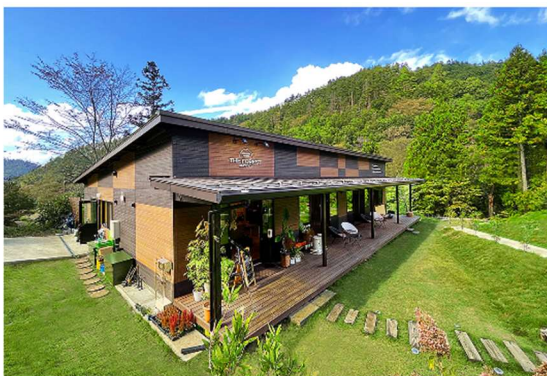
図表5 サテライトオフィスの案内

お試しサテライトオフィス「THE FOREST」では、都留市内で事業展開を計画している法人様の地方型サテライトオフィスとして、試験的に活用してみたいという企業を募集している。また、本格的に都留市内にサテライトオフィスを開設希望の企業には、社員の住居や空き物件の紹介など、サテライトオフィスのスタートアップをサポートする。