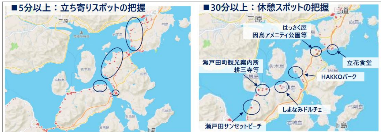
図表 4 収集データの分析を通じた滞在スポットの把握例