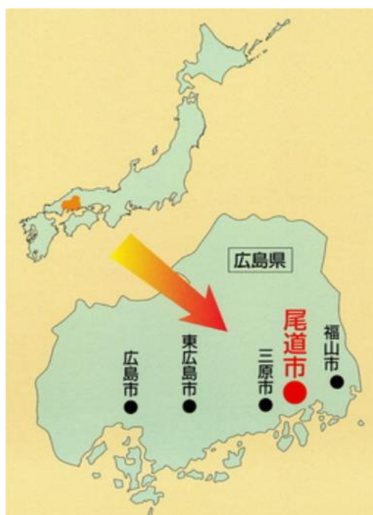
図表 1 尾道市 位置図