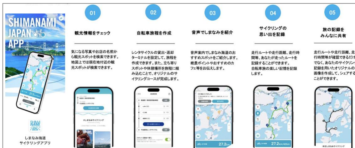
図表 3 「SHIMANAMI JAPAN」の機能

また、時間・走行距離・位置情報に応じたプッシュ通知で周辺の飲食店や観光施設をレコメンドし、立ち寄りを促す機能も実装している。旅行後（旅アト）には走行ルートのログを用いた画像生成やSNS共有機能を備える。こうしたアプリの開発にはナビタイムジャパンの経路探索技術を活用し、レンタサイクルターミナル間の旅程作成機能を実装した。2023年10月6日のリリース以降、利用者が増加しており、幅広く周遊プランを提供している。