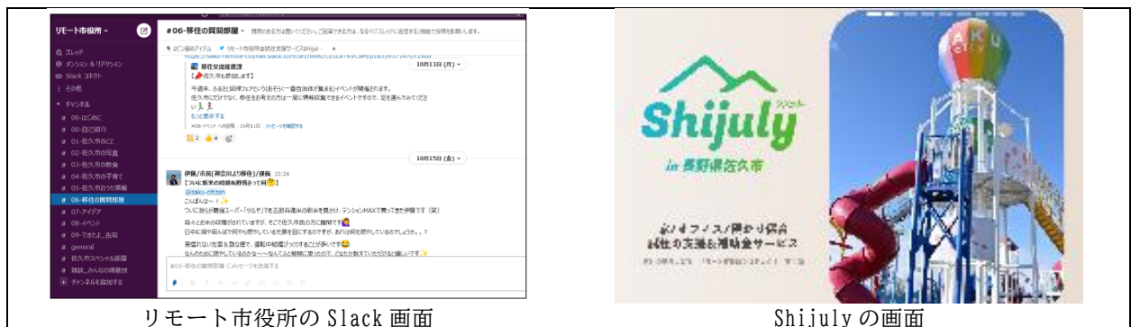
リモート市役所の Slack 画面