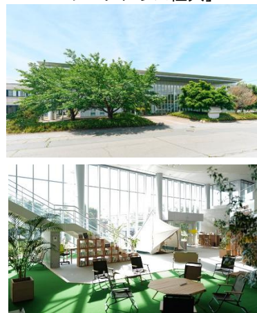
図表 2 県内最大級のコワーキング施設「ワークテラス佐久」

佐久市の移住・定住促進策は、①テレワーク環境の整備（リモートワークしやすい職住環境づくり）、②二地域居住に対する経済的支援（移住者や週末居住者への補助金等）、③情報発信・相談体制の充実（オンラインコミュニティや試住支援サービス）、そして④官民連携の推進体制から構成されている。テレワーク施設や移住者住宅の整備といったハード面と、補助制度やオンライン相談といったソフト面を組み合わせ、企業・団体との協働も活かしながら総合的に移住希望者の裾野拡大と定着支援を図っている。