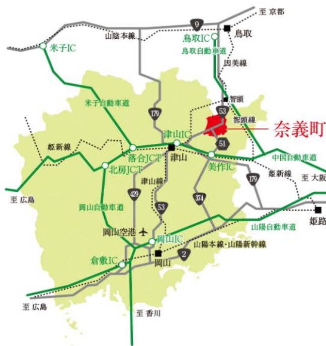
図表 1 奈義町位置図