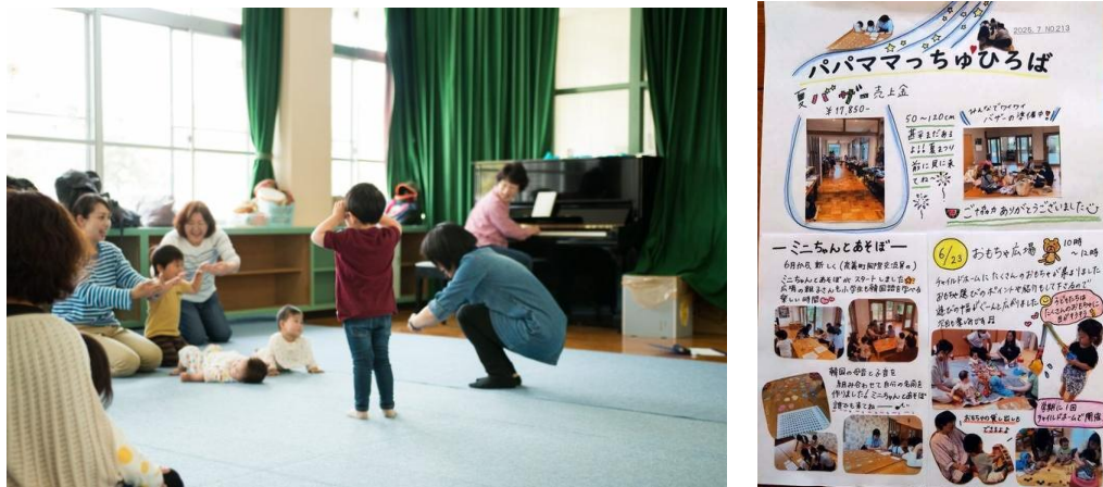
図表 3 なぎチャイルドホーム

児期の子どもたちに「家庭的な雰囲気の中で育てほしい」という願いから始まった自主的な保育活動である。「なぎチャイルドホームだより」を毎月発行し、イベント案内を行っている。