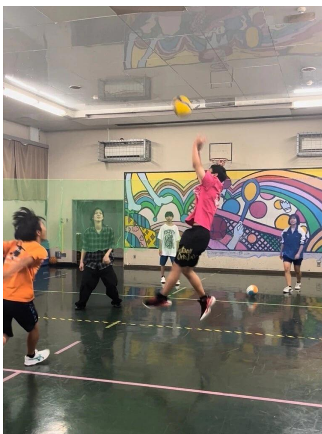
図表2 緑児童館の体育室の様子

利用者の多くは中学生であり、高校生の利用は少なく、市のSNS等の広報活動よりも友人に連れられて訪れるケースが多い。