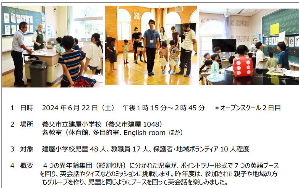
図表 3 オープンスクールの概要(2024年度)

建屋小学校では、「小さな学校発、世界につながる挑戦」を合言葉に英語学習に取り組んでおり、ALT(外国語指導助手)の常駐による日常的にネイティブな英語にふれる活動の実施に加えて、①イングリッシュマラソン(全校生:6月)、②オーストラリア パース市・ダルキース小学校訪問(6年生希望者:夏休み)、③オンライン英会話(5・6年生:通年)、④スピーチコンテスト(全校生:2月)などの特色ある英語教育を推進している。