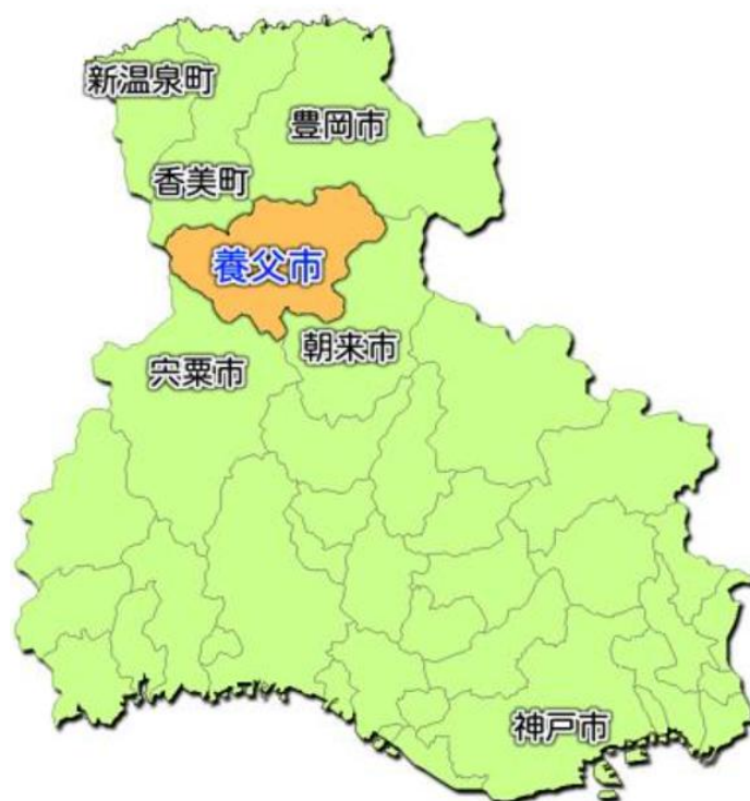
図表 1 養父市 位置図