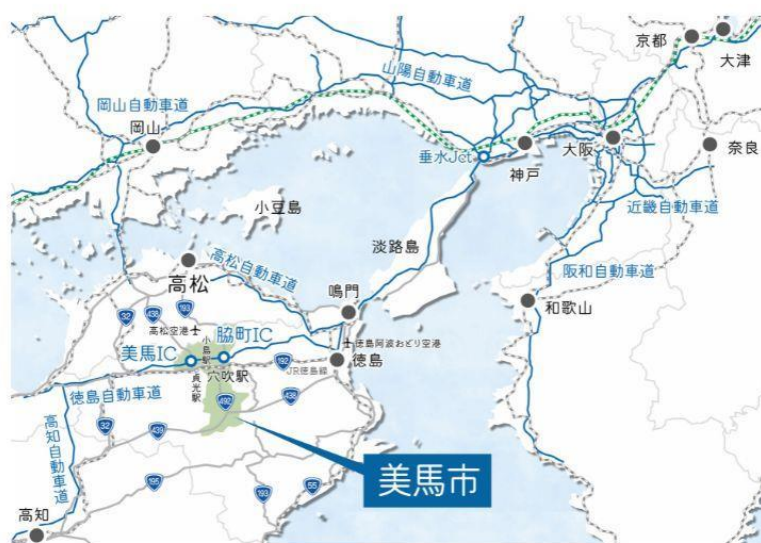
図表 1 徳島県美馬市の位置図

総面積 367.14 km 2 令和7年10月1日現在（国土地理院「全国都道府市区町村別面積調」）