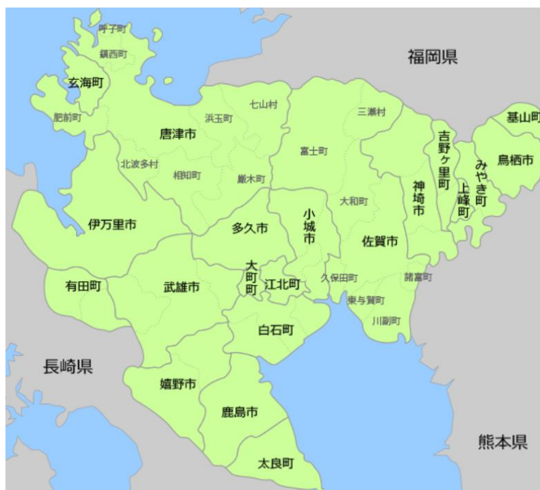
図表 1 佐賀県 位置図