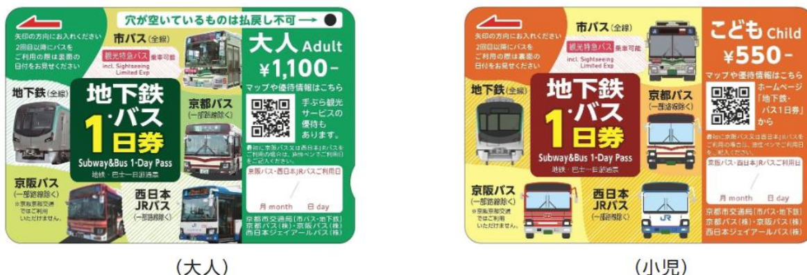
図表 3 地下鉄・バス1日券