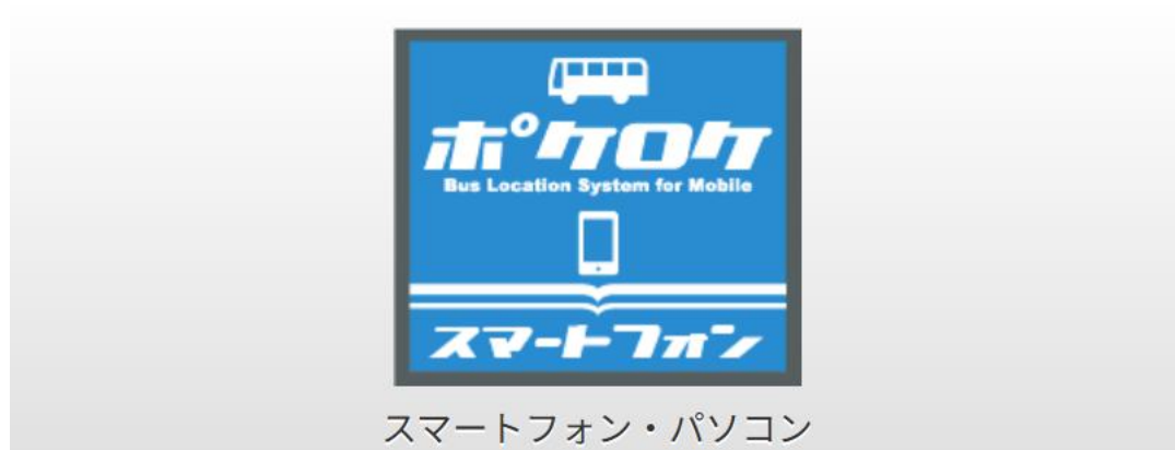
図表 4 京都市バス携帯型バスロケシステム（ポケロケ）

現在、「京都市バス携帯型バスロケシステム（ポケロケ）」を導入し、バス野接近情報を提供中である。令和7年度には、車両搭載のGPSデータ等を活用し、京都市交通局ホームページにおいて、市バスの車内混雑度や走行位置等を発信し、混雑緩和など利用者の利便性向上に取り組む予定である。