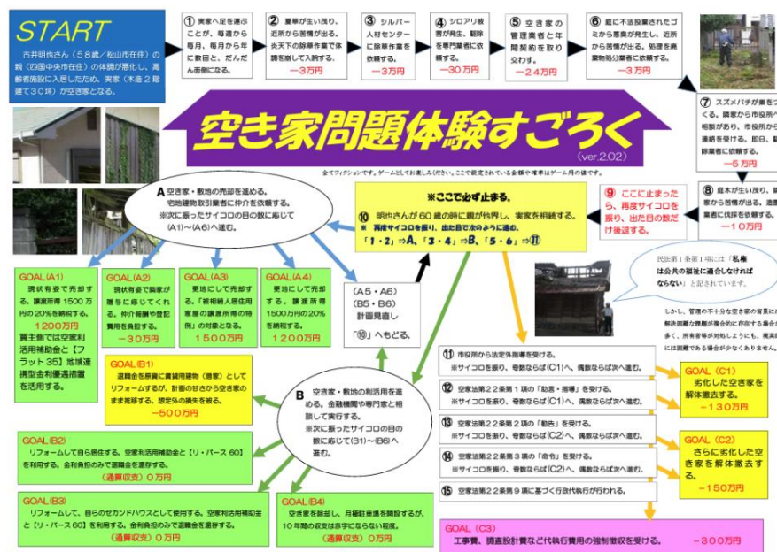
図表 2 空き家問題体験すごろく

住宅金融支援機構四国支店・愛知銀行と締結された協定により、金融サイドからの助言をもらうだけでなく、空き家問題に対応した「空き家問題体験すごろく」 i を制作。