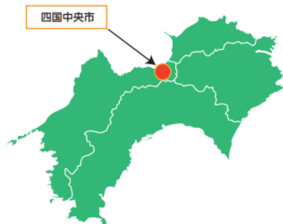
図表 1 四国中央市