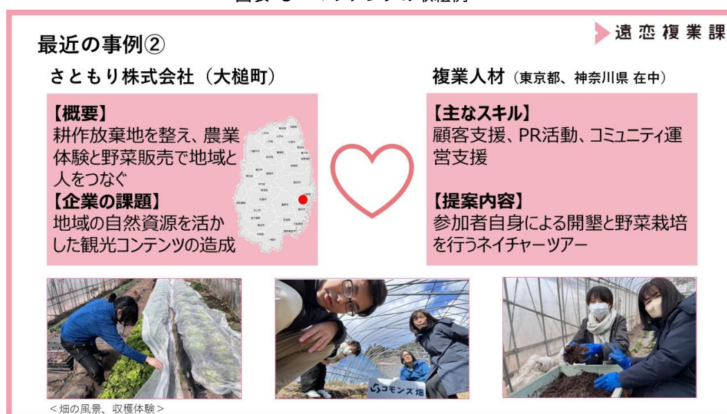
図表 5 マッチングの取組例

このように、遠恋複業の活用事例は震災復興支援からコロナ禍対応、移住者や地場企業の事業改善まで幅広く展開されており、最近の具体的なマッチングを通じて地域課題の解決と新たな可能性の創出につながっている。