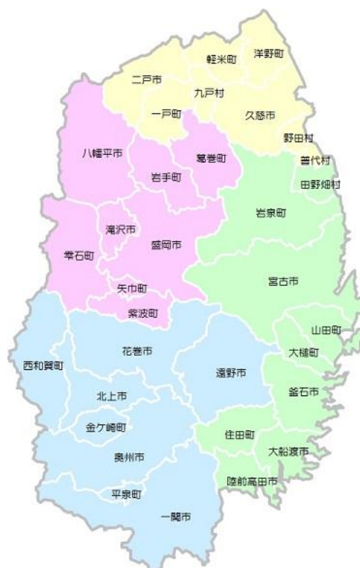
図表 1 岩手県の位置図