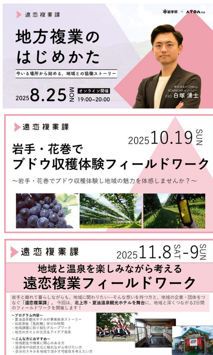
図表 4 セミナー・フィールドワークの取組例（2025年度）

岩手県では毎年度、複業人材向けと受入企業・団体向けの説明会・セミナーを定期的に行っている。岩手県内の企業・団体と複業で関わりたい方や、岩手出身者・岩手にゆかりのある方、地域課題の解決や地方創生に関心のある方など、多様で意欲の高い人材が集まり、当事業への関心の高さがうかがえる。企業・団体向けには県内で「複業人材受入セミナー」を開き、受入れのポイントや成功事例を紹介している。さらに、受入企業・団体の理解を深めるため、県内で現地フィールドワークを実施している。フィールドワークでは参加者が実際に企業を訪れ、経営者から直接課題やビジョンを聞くことで、地域への理解と複業意欲を高める効果を上げている。