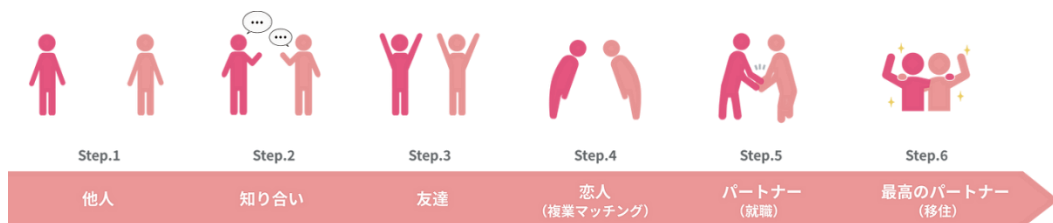
図表 3 パートナーまでの流れと人材マッチングにおけるプロセス例

遠恋複業のプロセスは、まず複業を希望する首都圏等の在住者（複業人材）と、複業受入れを検討する県内企業・団体がそれぞれエントリーや申込みを行うことから始まる。事務局ではその後双方にヒアリングを行い、互いのニーズや強みを確認する。ヒアリング結果を踏まえ、マッチングイベントや個別商談などによって具体的な業務提携に向けた協議を進めていく。事務局はこの過程を通じて両者のコミュニケーションをサポートし、長期にわたり継続可能な協働関係（いわば“恋人関係”）を構築する手助けを行っている。