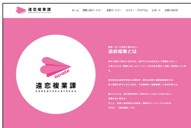
図表 2 遠恋複業課特設サイト

2024年度からは、全国規模の複業人材プラットフォームを運営する株式会社ATOMicaが事業運営に参画し、首都圏におけるセミナー開催や、フィールドワーク、マッチング会の開催等、市区町村を巻き込んだ自治体間連携を一層強化している。同年度には遠恋複業課の特設サイトも公開され、事業の情報発信や参加者募集をより広く展開できるようになった。2025年度には、ロゴマークをリニューアルした。新ロゴマークは「遠恋×（かける）つながる」というテーマを紙飛行機で表現しており、紙飛行機は距離を超えて人と人とがつながる象徴であると同時に、温もりを感じられるモチーフとして採用されている。