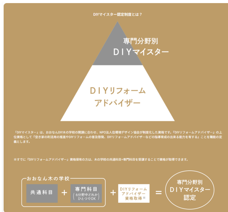
図表 6 DIYマイスター認定制度

木の学校の共通科目と専門科目のいずれか1科目を受講し、DIYリフォームアドバイザーの資格を有することで「DIYマイスター」の資格を取得することができる。