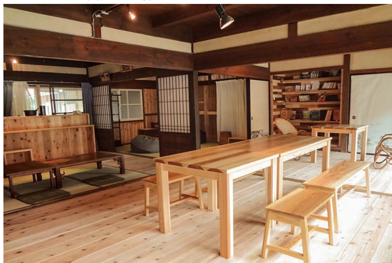
図表3 町内のゲストハウス mikke

ワークショップ以外の各カリキュラムは2日間のスケジュールとなっており、DIYやリノベーション技能、古民家再生手法の体験ができる。受講生には、町内で古民家を改修した宿泊施設を案内しており、森の図書館にも宿泊が可能となっている。