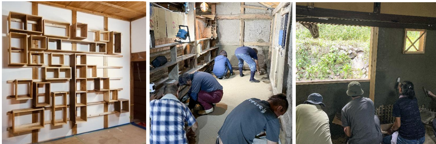
図表 5 実習の様子（左から、壁造り付け棚、三和土の作成、土壁の再生）